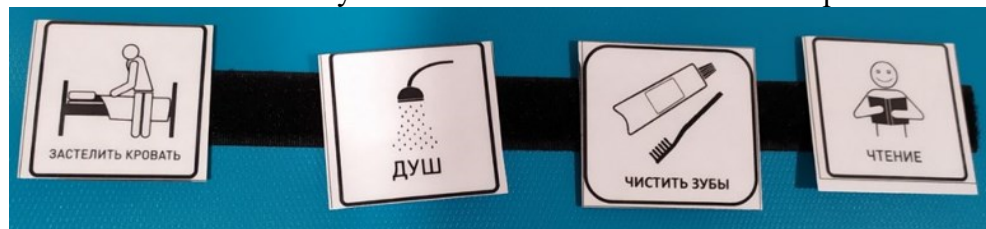
Рис.2 Расписание дня с карточкой «Чистить зубы»

• В течение дня обсуждать, что все чистят зубы, играть в чистку зубов куклам и игрушечным животным, читать книги о чистке зубов. Обсудить последствия отказа от чистки